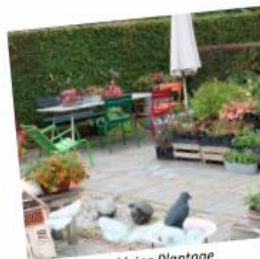
De kleine Plantage

Ieder gaat met eigen vervoer, of probeer samen te rijden. Afstand naar eerste tuin is ong. 145 km. We overnachten bij hotel Van der Valk Zuidbroek, Burgemeester Omtaweg 4, 9636 EM Zuidbroek. De totaalprijs voor deze mooie en inspirerende reis bedraagt €140.00 per persoon op basis van een tweepersoonskamer en lid van Groei & Bloei. Niet leden betalen €10.00 extra. De toeslag voor een eenpersoonskamer bedraagt €35.00. Opgave op de ledenavond, of bel met Tine van den Berg en geef je op: 06 47383436.